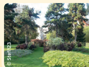
Le square Serment de Koufra