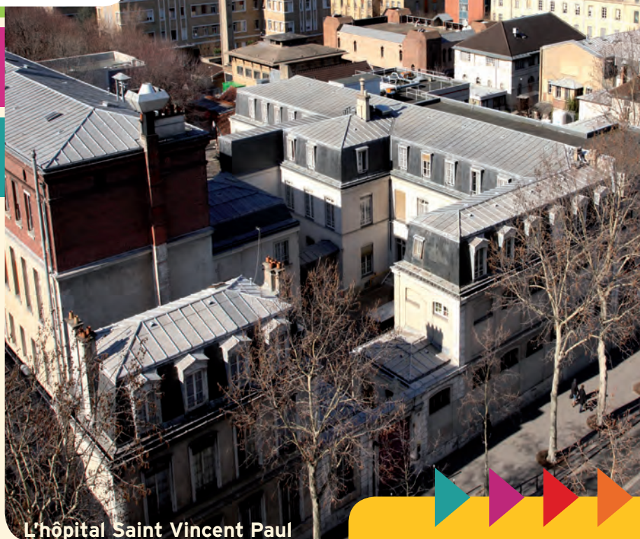
L'hôpital Saint Vincent Paul