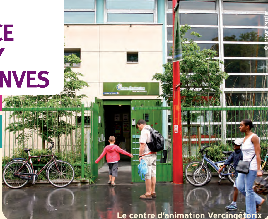
Le centre d'animation Vercingétorix