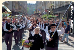
La fête de la Bretagne