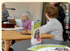
Le point Accueil Paris Emeraude