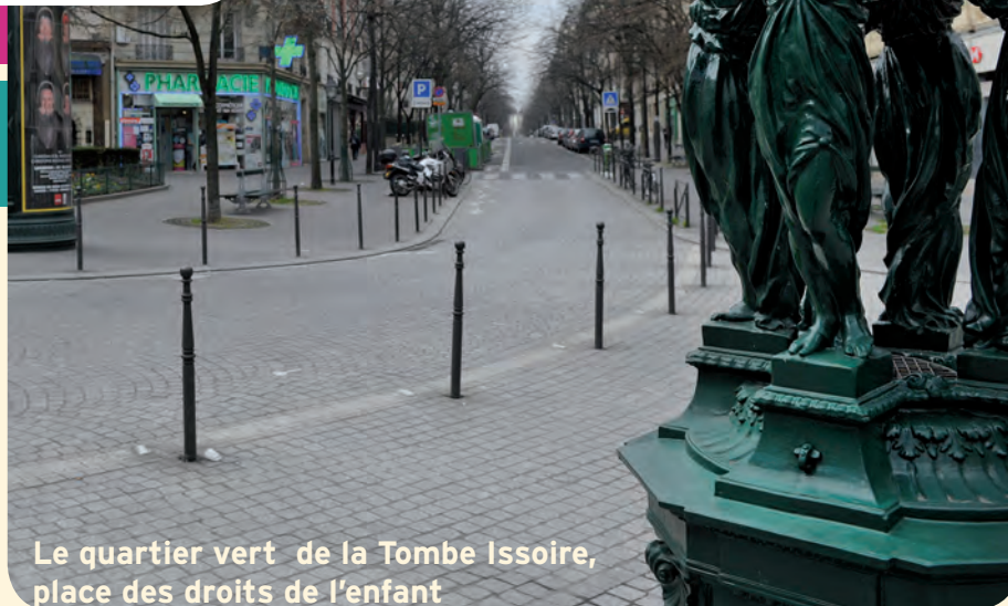
Le quartier vert de la Tombe Issoire, place des droits de l'enfant