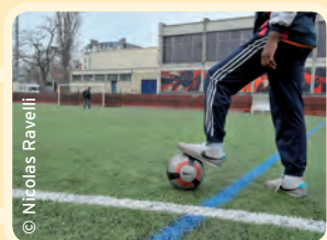
Le stade Elisabeth