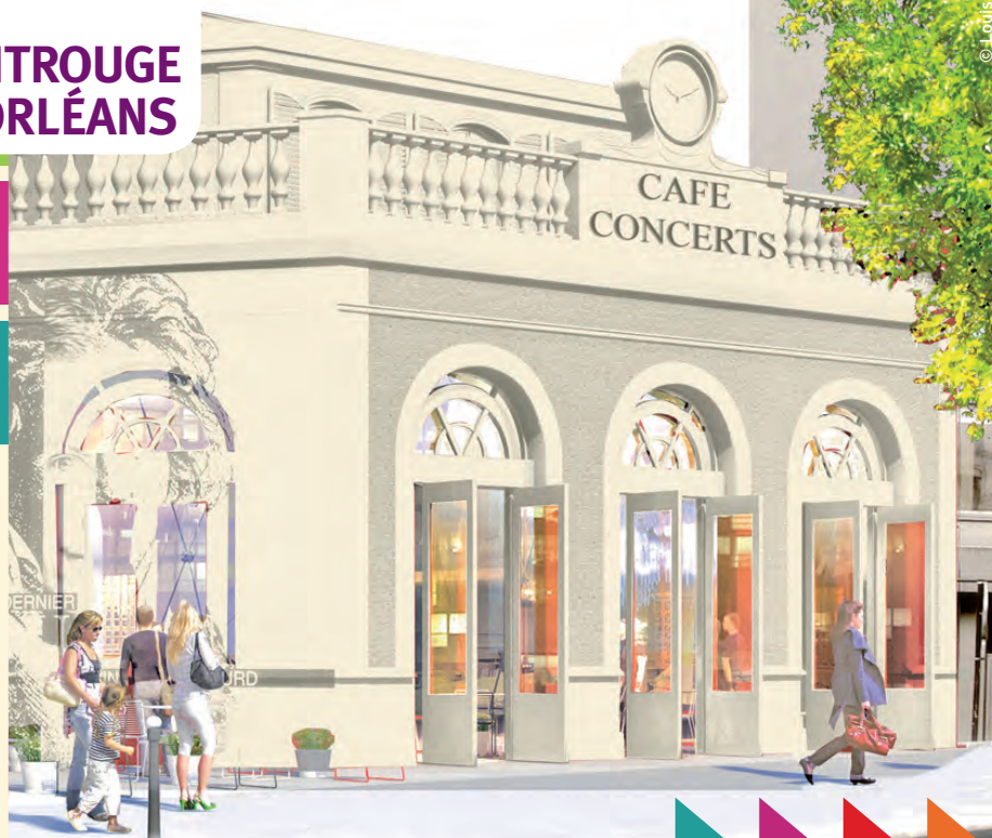
La nouvelle gare de Montrouge