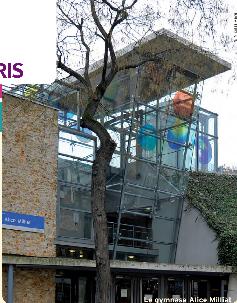
Le gymnase Alice Milliat

› Développement des activités sportives pour les familles, le dimanche au gymnase Milliat.