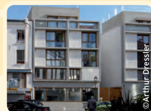
La bibliothèque Vandamme