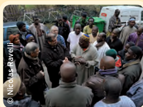
Le foyer de travailleurs migrants Arbustes