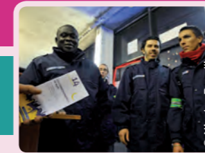
Le groupe scolaire Alain Fournier