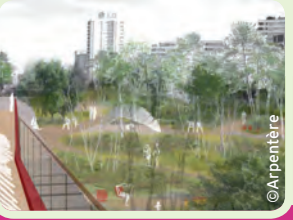
La couverture du périphérique Porte de Vanves