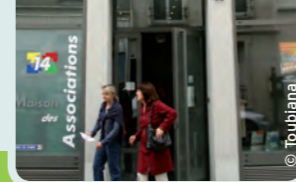
La maison des associations