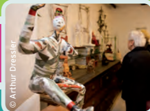
Les journées Portes ouvertes des ateliers d'artistes