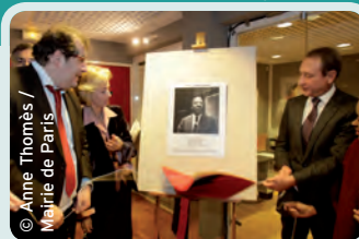
La bibliothèque Aimé Césaire

Le 14 e , un arrondissement qui s'engage et qui crée