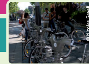
80 stations de Vélib'