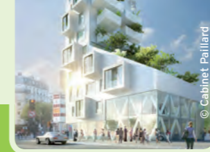
Le projet de rénovation de l'ancienne gare de Montrouge