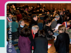
Paris 14 Culture foot