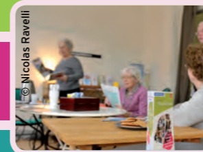
Le point d'accueil Paris Emeraude