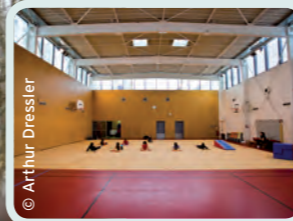
Le gymnase Rosa Parks